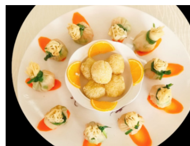
图为康旅中心创新研发菜式石榴虾球