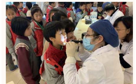
医务人员为上海浦锦世博小学和北京府学胡同小学朝阳学校的同学检查口腔

云南白药牙膏关注口腔健康走进校园公益活动将继续前往更多地区，提升同学们的口腔健康意识，培养良好的口腔卫生习惯，从而预防口腔疾病的发生，呵护人口腔健康。（健康品事业部）