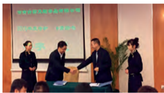
(天颐茶品总经理与业务负责人签署目标责任书)

天颐茶品“把握机会 逆势飞扬”——2016年工作部署会于近期顺利举行。会议对2015年企业各项工作开展进行了回顾，并结合市场、行业趋势，对2016年工作展