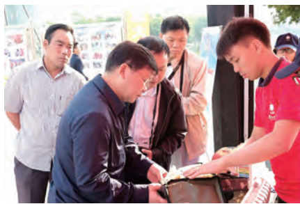
(向来宾介绍云南白药急救包的使用方法。)