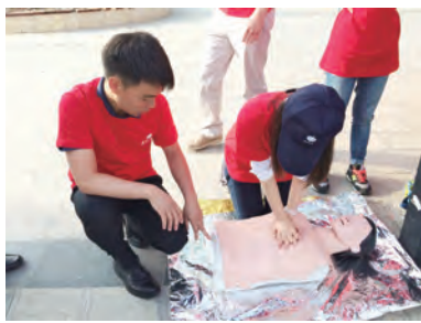
(应急急救培训团队现场演示急救方法。)