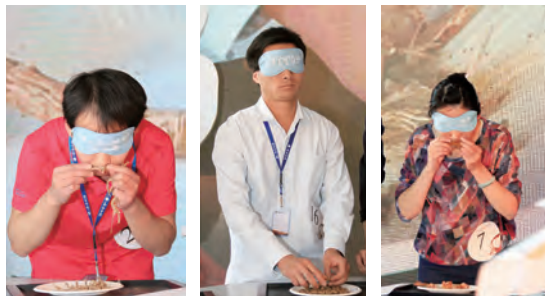
第三轮:蒙眼辨药,真正高手对决。

让选手在看不见的情况下,通过手摸、鼻闻、嘴尝等方式在一分钟内辨认出药材名称。两个多小时的比赛中,比赛难度层层递进,选手晋级人数逐渐减少,现场啦啦队也随选手一起心里的弦越绷越紧。