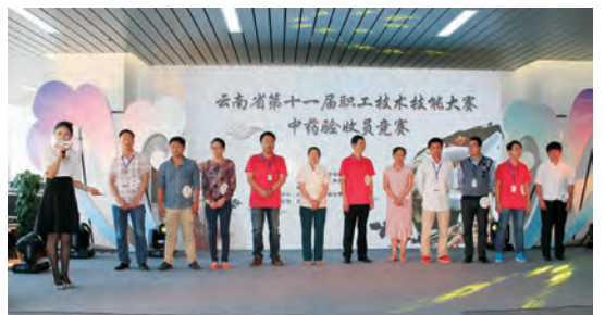
第二轮:限时问答,谁才是中药高手?