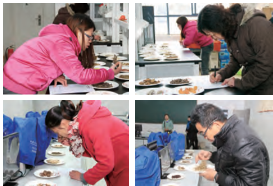
短时间内进行多种药材的辨认,充分反映选手实操水平。