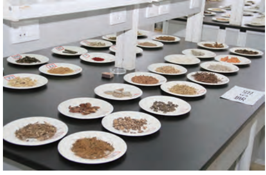
整齐划一的考试操作台,为复赛公平公正奠定基础。