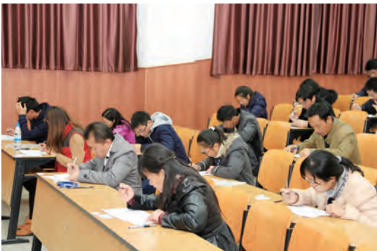
理论考试现场,成绩优异者晋级复赛。