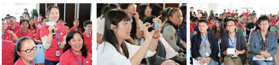
现场观众的热情与参与给了比赛最大的支持与鼓励,他们是整场比赛不可或缺的主角。

本次决赛邀请到省中医学院、省药检所以及云南白药的中医药专家担当评委,评委们谨慎细致的评分成为竞赛圆满落幕的必备因素;专家们字字珠玑的点评成为整场比赛的点睛之笔。