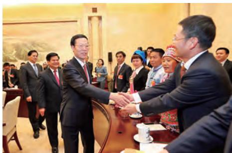
中央政治局常委、国务院副总理、党组书记张高丽与王明辉总裁亲切握手。

2015年3月5日至13日,云南白药控股有限公司党委书记、总裁,云南白药集团董事长王明辉作为全国人大代表出席全国人大十二届三次会议,并提交《关于依法治国,保护经营者合法权益、促进市场经济健康有序发展的建议》及《关于老年人部分基本药物在基层实行全额报销促进健康公平的建议》两项议案。