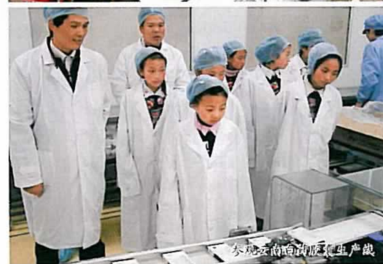
参观云南白药胶囊生产线