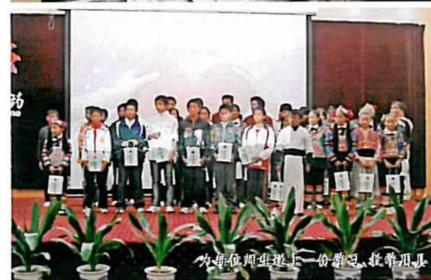
为每位师生送上一份惊喜、教学用具