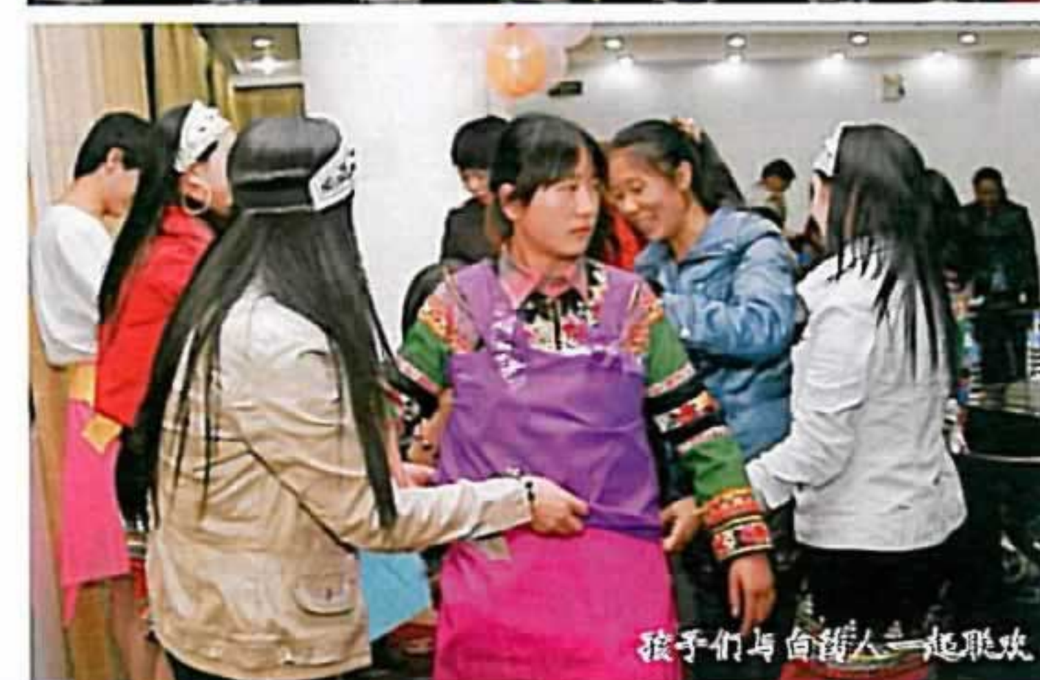
孩子们与白药人一起联欢