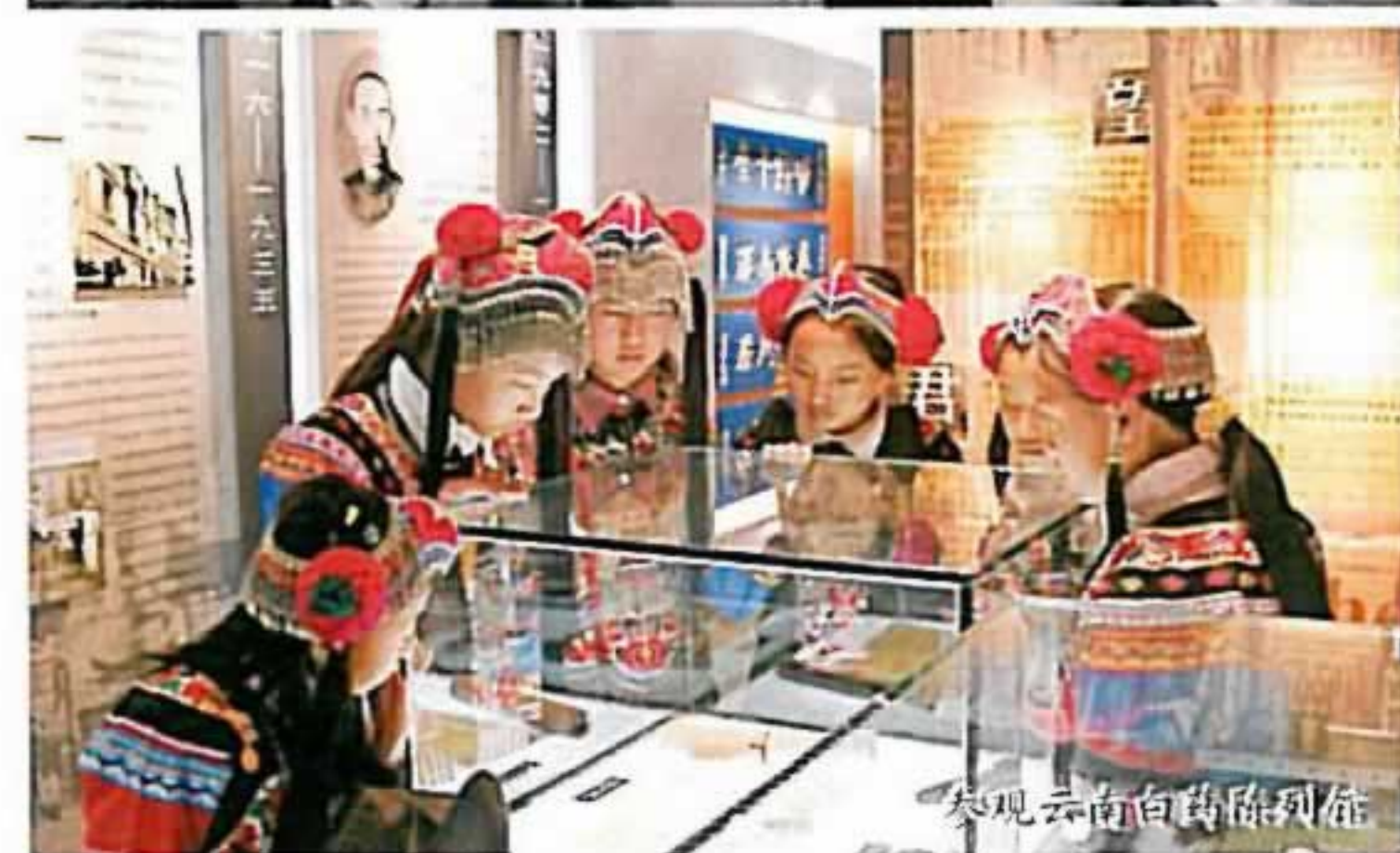
参观云南白药陈列馆