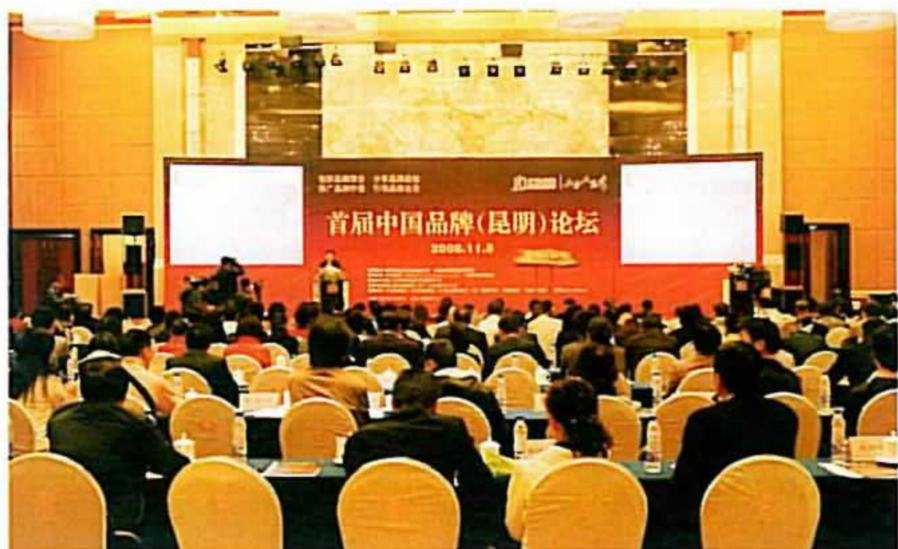
在国家质量监督检验检疫总局、中国名牌战略推进委员会的

直接指导下,以“传播先进理念、搭建品牌建设桥梁”为宗旨的首届中国品牌(昆明)论坛于11月8日、9日在昆明举行,云南30个品牌荣获三大奖,云南白药众望所归,荣获“云南十大最具影响力品牌”奖。