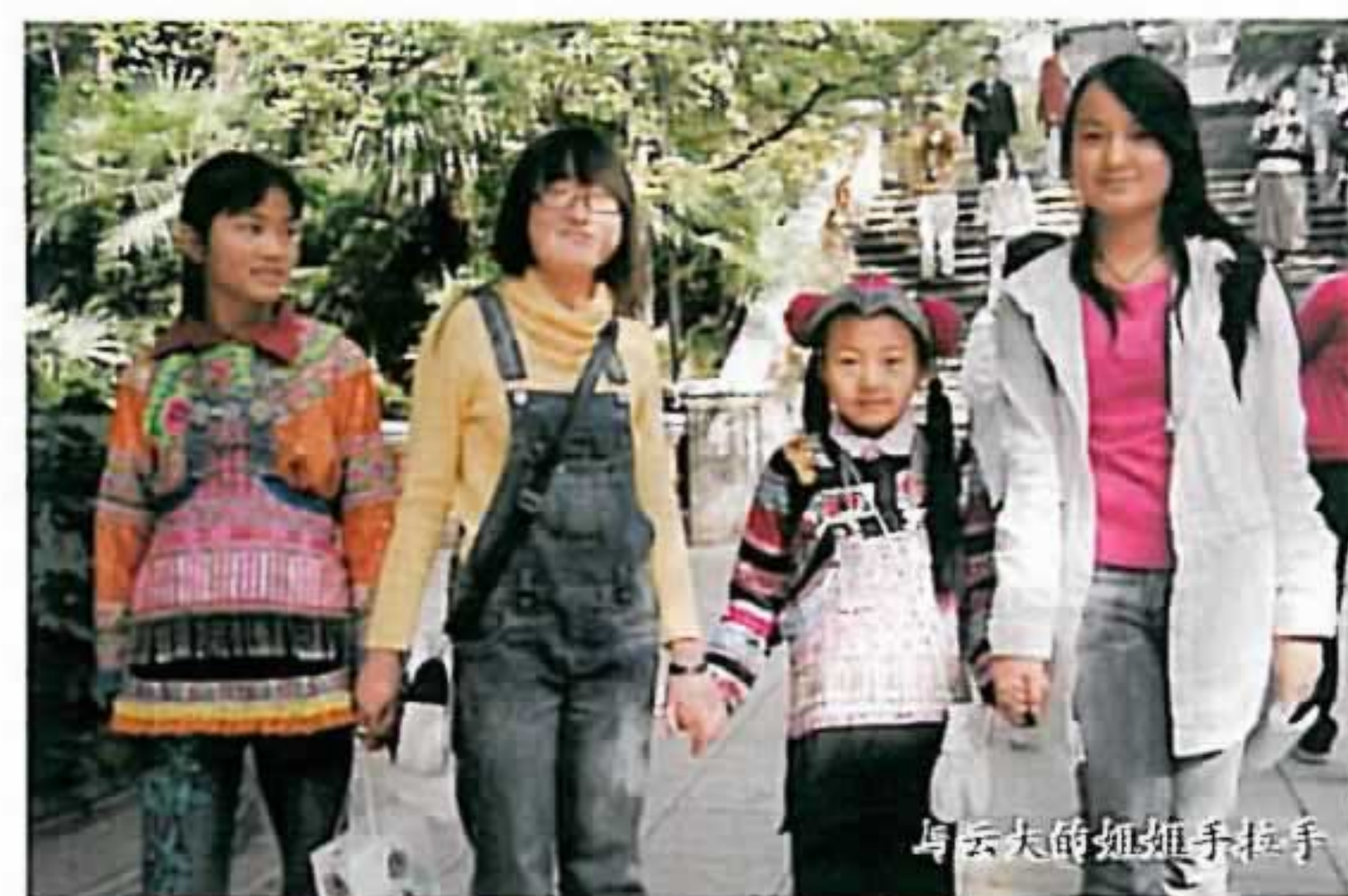
与云大的姐姐手拉手