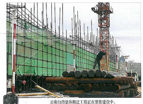
图为位于呈贡新区的厂区建设现场

通过民主生活会上的发言和大家对《云南白药集团领导班子学习实践科学发展观分析检查报告(征求意见稿)》修订完善后的建议,集团正式形成了《云南白药集团领导班子学习实践科学发展观分析检查报告》,并着手开始组织对班子学习实践活动办公室根据征求意见意见和建议进一步修订完善意见和建议,真正形成一份高质量的分析和检查报告,并作为下一阶段整改落实阶段开展的工作做好准备。(集团深入学习实践科学发展观活动办公室)