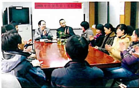
最后杨总和乔副总分别为优秀主管(员工)颁奖。(吴东)

杨总勉励大家在新的一年里工作上继续有所创新,再创佳绩,乔副总也对公司当前所面临的严峻形势作了分析,并提出了2009年公司的营销战略及目标,希望大家一鼓作气,共度难关。