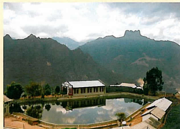
老妈登山教堂